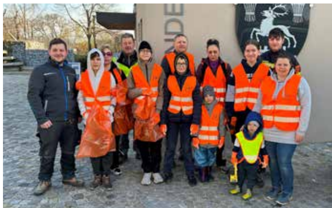
Die Freiwilligen der KG Jaidhof mit Unterstützung der Feuerwehrjugend.