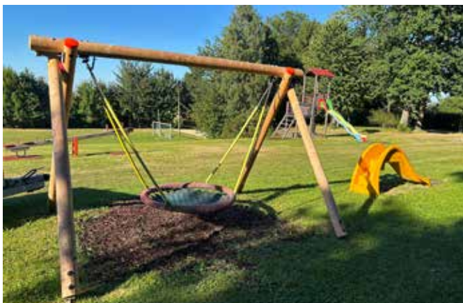
Die Nestschaukel wurde restauriert

Nestschaukel, die neue Babyrutsche und die weiteren Spielgeräte bereits wieder genutzt werden. Eltern und Großeltern sind herzlich eingeladen, gemeinsam mit den Kindern die Anlage zu entdecken und die frische Spiellust vor Ort zu genießen.