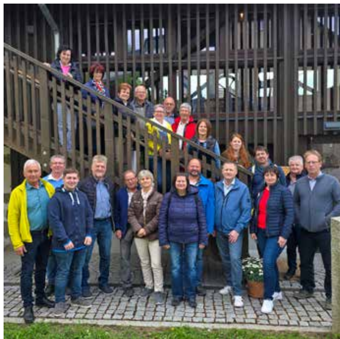
Zahlreiche Gemeindebedienstete und Gemeindefraktare folgten der Einladung und verbrachten einen abwechslungsreichen Tag in Haslach

Das einhellige Resümee: ein gelungener Ausflug.