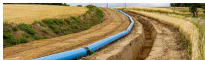
Aktuelle Leitungsverlegearbeiten

Im ersten Schritt werden die Bewohner der KG Eisengraben an die neue Trinkwasserversorgung angeschlossen. Genauere Informationen erhalten diese in einem persönlichen Schreiben.