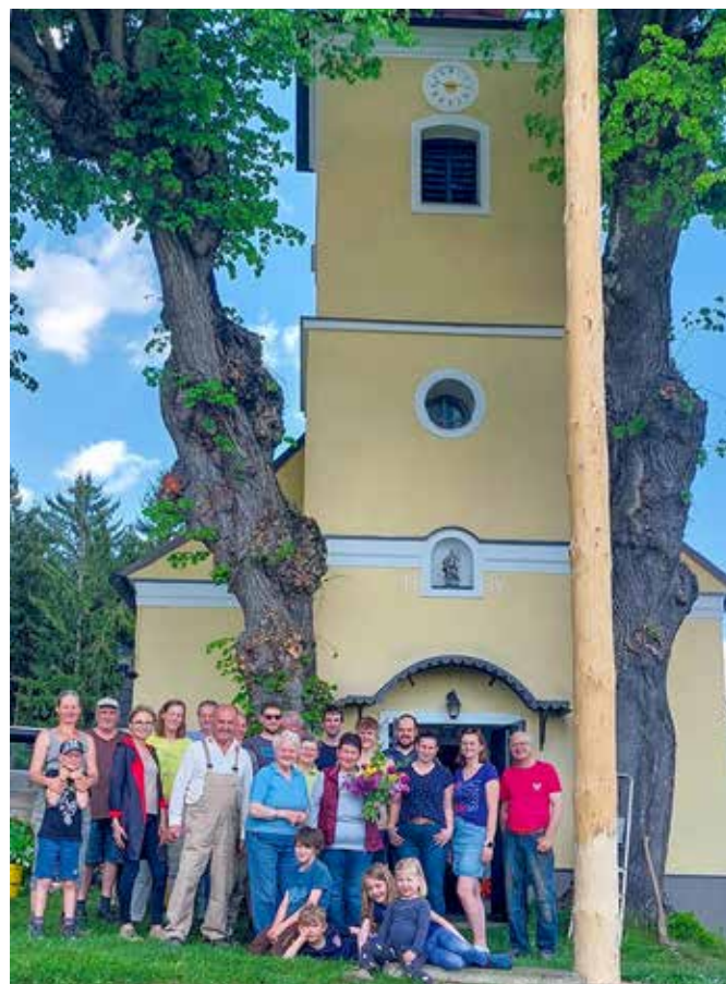
Die Kapellengemeinschaft bedankt sich bei den Besuchern und freut sich auf ein Wiedersehen im nächsten Jahr.