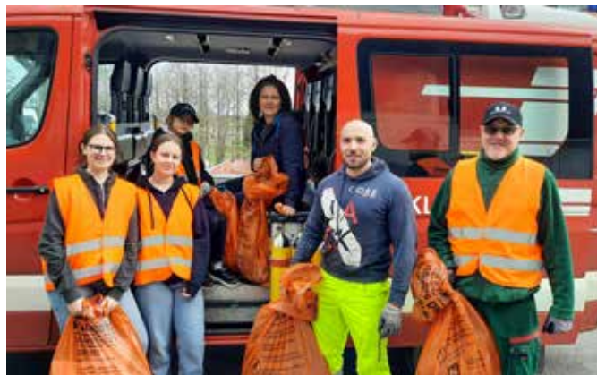
In der KG Eisengraben gab es Hilfe von der FF Eisengraben.