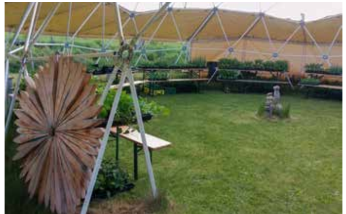
Jungpflanzenmarkt am Emilienhof

Vielen Dank allen Besuchern! Die Emilienhofbewirtschafter freuen sich auf den Pflanzenmarkt 2026!