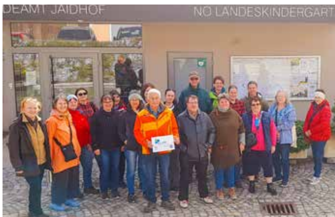
Die Teilnehmer des Waldworkshops

auch, den Stoffwechsel nach den Wintermonaten wieder in Schwung zu bringen. Die Begeisterung der Teilnehmenden war groß – viele zeigten sich überrascht, wie vielseitig die oft unscheinbaren Pflanzen am Wegesrand verwendet werden können. Das KLAR!-Team freut sich über die positive Resonanz und arbeitet bereits an weiteren Veranstaltungen. Gefördert wird das Projekt aus Mitteln des Klima- und Energiefonds im Rahmen des Programms KLAR! Region Kampseen.