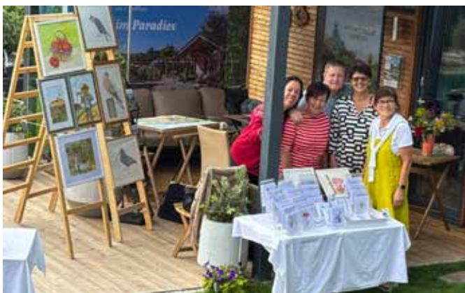
Bei kaiserlichen Wetter präsentierten sich abwechselnd die Künstler des Jaidhofer Malkreises

Die Kittenberger Erlebnisgärten luden vom 7. bis 9. Juni 2025 zu ihren Künstlerischen Pfingsten.