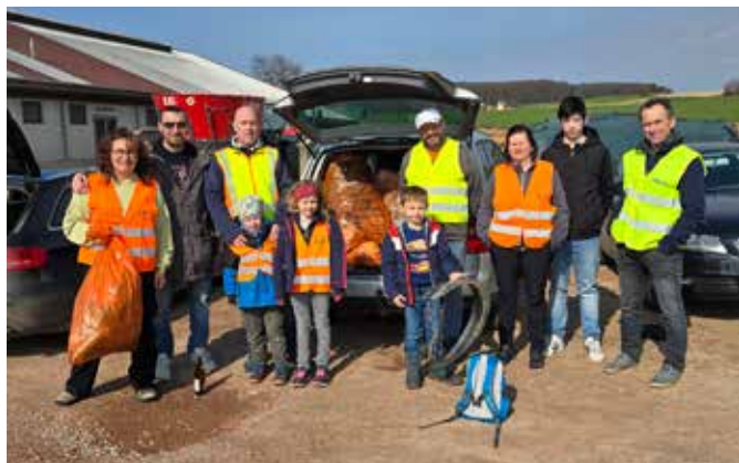
Die Helferinnen und Helfer der KG Schiltingeramts.