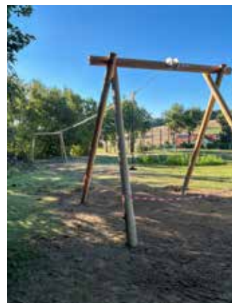
Die Seilbahn und die Rutsche wurden erneuert