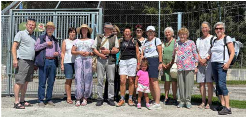
Die Künstler des Malkreises auf Exkursion im Bärenwald Arbesbach

Die künstlerischen Arbeiten inkludierten einen Besuch des BÄRENWALD Arbesbach, einer Auffangstation der Tierschutzorganisation VIER PFOTEN für Bären in Not. Eingebettet in die walddreiche Landschaft des Waldviertels besuchten die Mitglieder das Schutzzentrum,