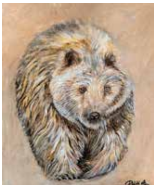
Kalenderbild Poldi Aschauer © Jaidhofer Malkreis

Samstag, 18.10, 14-18 Uhr Sonntag, 19.10, 10-16 Uhr Ort: Gemeindeamt Jaidhof