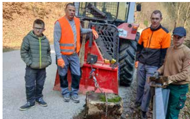
Die fleißigen Sammler der KG Eisengraberamt