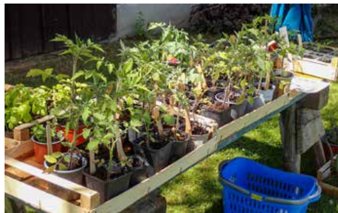
Zahlreiche Jungpflanzen standen beim zweiten Tauschmarkt zur Auswahl und bekamen neue Besitzer.

Die Produktpalette der Gartenhummel ist breit gefächert und reicht von Kräutertees, Fruchtaufstriche und Chutneys bis hin zu Sirupen.