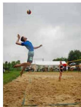
Gute Stimmung trotz Regen

Der UV Gföhl richtet den Blick nun bereits auf die kommende Hallensaison. Dort wird der Verein in der W4tel Mixed Liga antreten und freut sich auf ein intensives Training sowie spannende Begegnungen in der Meisterschaft."