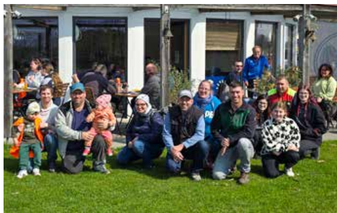
Stärkung gab es für alle fleißigen Sammler am Erholungsteich.

Die Aktion wurde von den Gemeindeverbänden Krems und Zwettl unterstützt. Weitere Infos und Ergebnisse gibt es auf www.stopplittering.at .