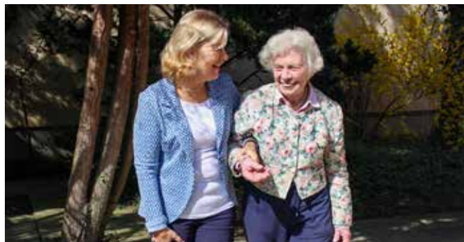
Gelebte Nachbarschaftshilfe

Jaidhof setzt ein Zeichen für gelebtes Miteinander: Am 24. November um 18:30 Uhr laden die Gemeinde Jaidhof und die Stadtgemeinde Gföhl zur Infoveranstaltung „Zeitpolster – Netzwerk für Vorsorge und Betreuung“ in den Stadtsaal Gföhl ein. Willkommen sind alle, die