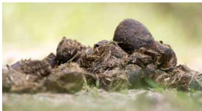
Vermeehrt Verunreinigungen durch Pferdeäpfel

Auch Reiterinnen und Reiter sind aufgefordert, Pferdemit auf öffentlichen Wegen unmittelbar nach dem Ausritt zu beseitigen. Vielen Dank für Ihr Verständnis und Ihre Mithilfe!