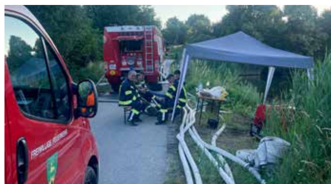
Rund 4.000 m 3 Wasser wurden über mehrere Tage vom Drescherteich in den Straßenteich gepumpt